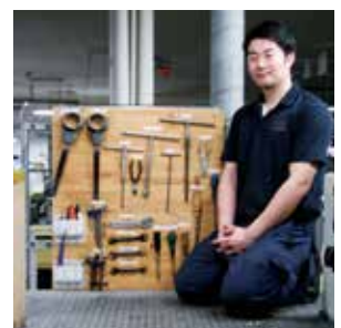
試行錯誤して作ったオペレーターたちのオリジナル宝箱です。

風流印字（ふうりゅういんじ）「風流韻事」の造語。興味深い記事を書いた印刷物の意。